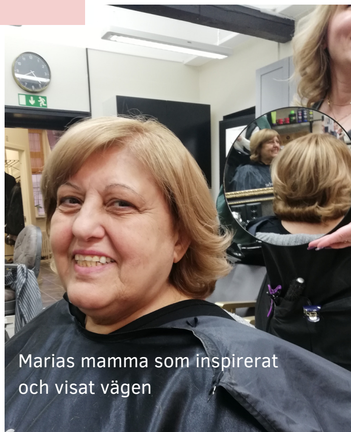
Marias mamma som inspirerat och visat vägen