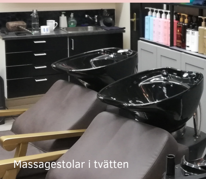
Massagestolar i tvätten